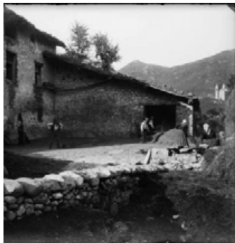
Figura 7: Grup d'homos i dones treballant a la masia de Crexenturri de Camprodon.

Un darrer element rellevant de conèixer són els noms i conceptes que els llibres de viatge