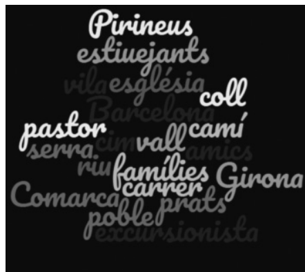
Figura 10: Substantius més repetits en les publicacions analitzades.