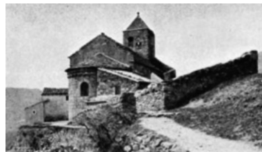
Figura 6: Església de Sant Feliu de Rocabruna.