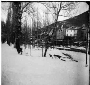
Figura 4: Paisatge nevat de Camprodon des del riu.

Una altra qüestió interessant d'estudiar és la caracterització dels paisatges humans, naturals i culturals immortalitzats (figura 8). En primer lloc, els paisatges humans són els menys representatius i fan referència, gairebé únicament, a les activitats festives religioses, com els aplecs, o a les activitats tradicionals del món rural, com la càrrega d'herba