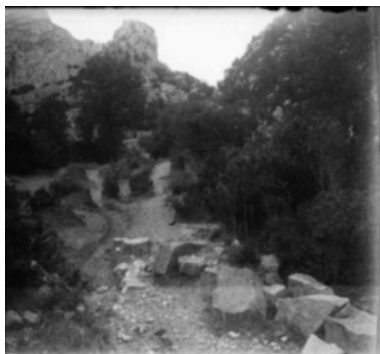
Figura 5: Font dels entorns de Camprodon.