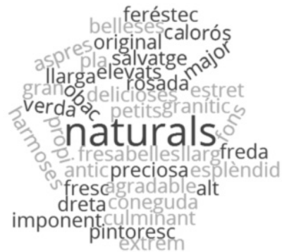
Figura 9: Adjectius més freqüents entre les publicacions estudiades.

En aquest sentit, els llibres de viatge de la vall de Camprodon escrits entre final del segle XIX i principi del segle XX pels primers visitants estableixen unes imatges universals i arquetípiques de la contrada, les quals actuen com a referents col·lectius al llarg del temps